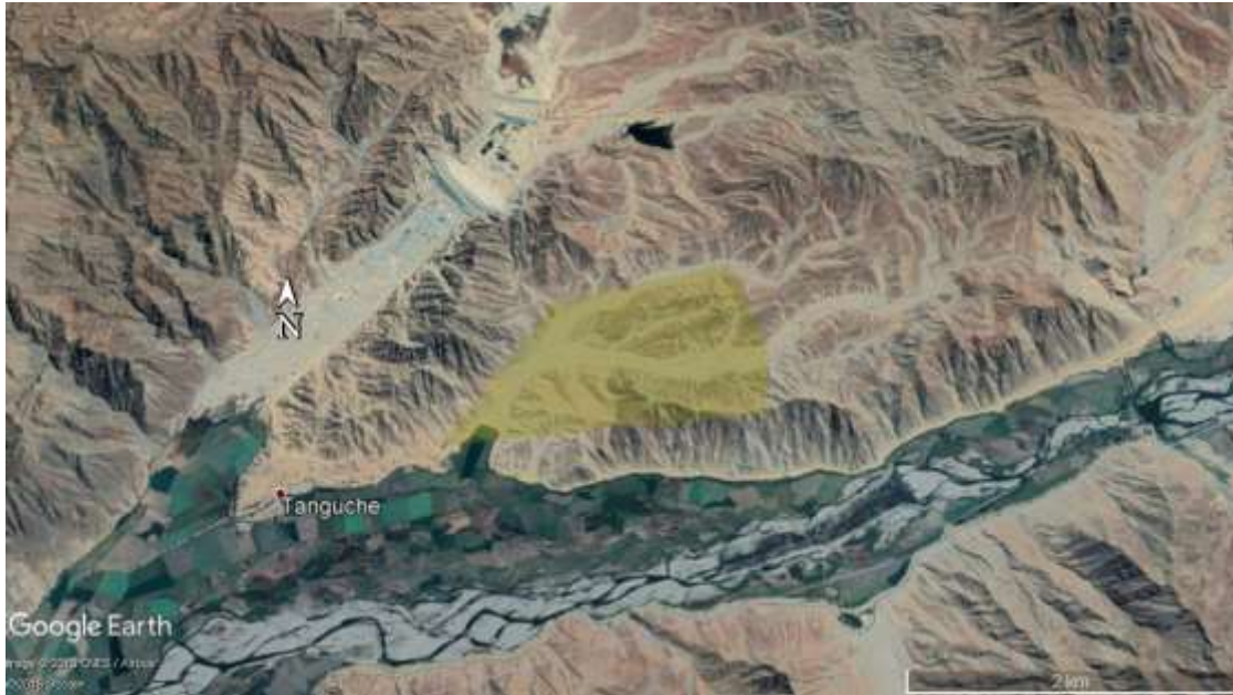
Figura 4. Área de turismo sostenible.

La explotación sostenible en la gastronomía mediante las rocas se identifica como insumo en la elaboración de la sopa de la piedra. Existen tres referentes sobre esta sopa, el primero del siglo V en México donde se sirven la piedra de río (guijarro) con pescado y marisco para su elaboración. En Portugal S. XVI como alimento usado por los viajeros en la utilización de rocas de río combinando diversos alimentos, y en el Perú hasta 2015 que es reconocida por un potaje emblemático que no resalta con claridad qué tipo de piedra se utiliza y con qué alimentos se combina la sopa de la subregión de Lima.