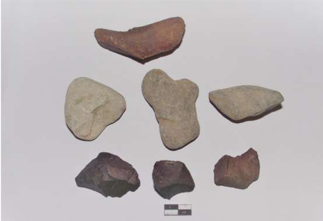
Figura 2. Muestras de rocas del valle de Chao.

El turismo es un modelo económico que permite desarrollar una serie de factores relacionados con la explotación responsable de los recursos naturales y culturales. El estudio del turismo se puede definir como: un conjunto de acciones y procesos que son realizados por viajeros quienes se trasladan de su espacio de residencia a un destino elegido, sus acciones tienen una tendencia de motivación y satisfacción personal o laboral durante su periodo de estancia. Cada acción está relacionada con un estado de bienestar que permite a estas personas valorar los bienes o servicios que adquiere. (González y Espino, 2015, p.25)