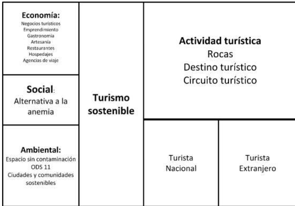
Figura 6. Modelo de turismo sostenible.