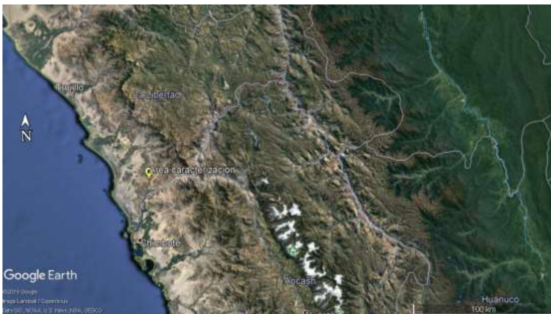
Figura 3. Ubicación de rocas para turismo sostenible.

A nivel económico debemos empezar por identificar geográficamente donde se encuentran el territorio donde se ubican las rocas que fueron estudiadas y que forman parte de la propuesta de turismo sostenible. Sumándose los resultados que son indicadores para tomar decisiones en cómo desarrollar el modelo de turismo sostenible.