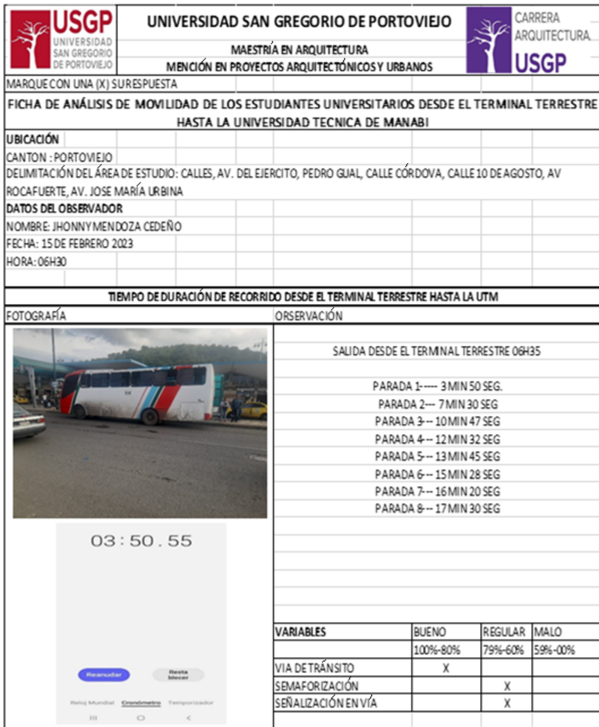
Figura 2. Ficha de observación empleada para la medición del tiempo del recorrido.