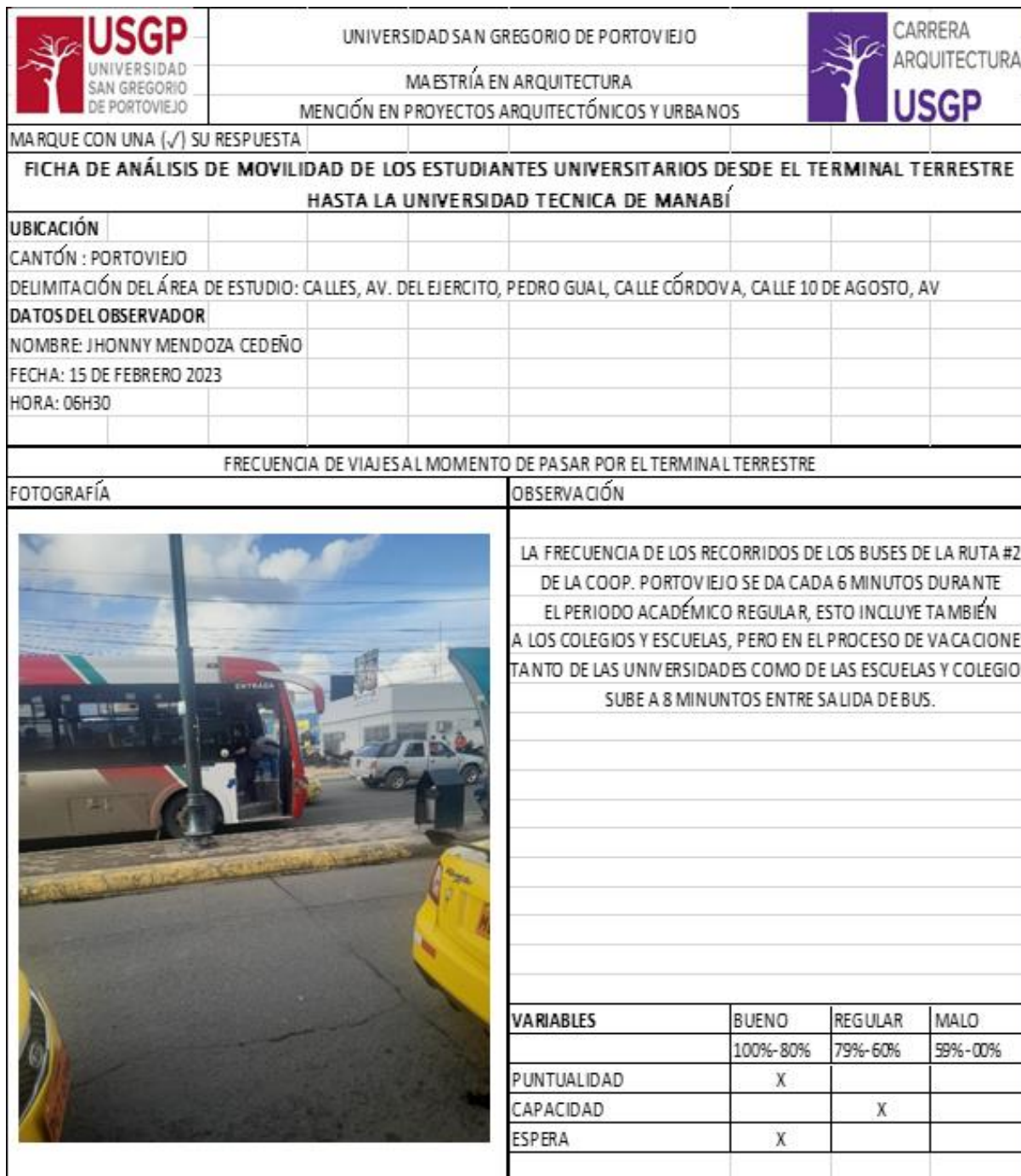
Figura 5. Ficha de observación empleada para la valoración de las frecuencias.