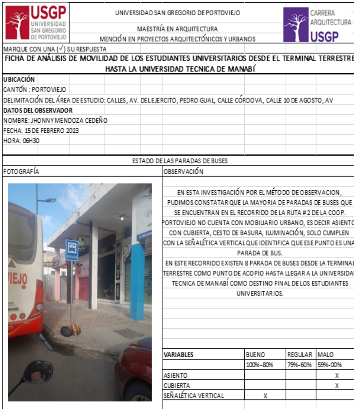
Figura 4. Ficha de observación empleada para la valoración del equipamiento.