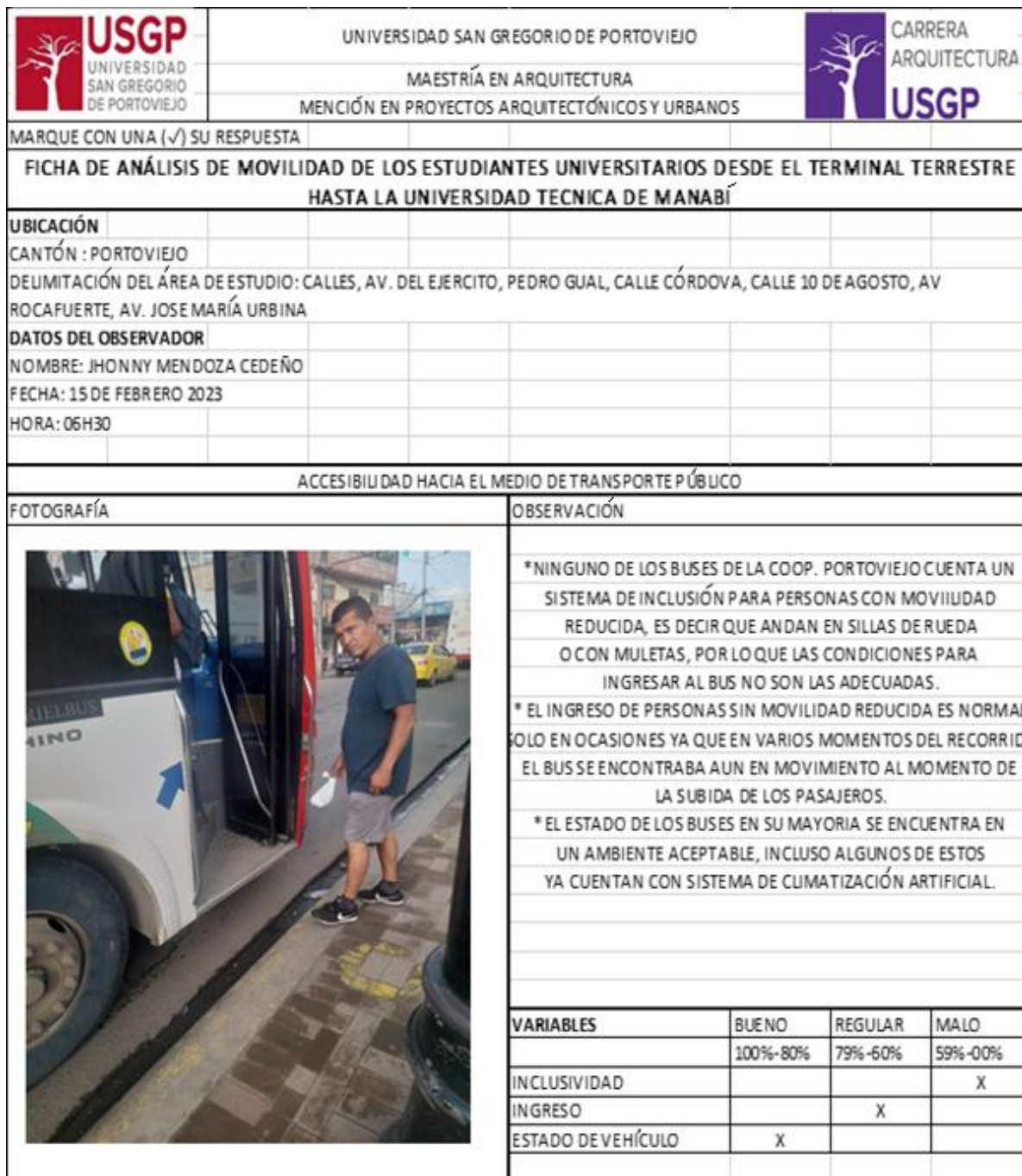
Figura 3. Ficha de observación empleada para la valoración de la accesibilidad.